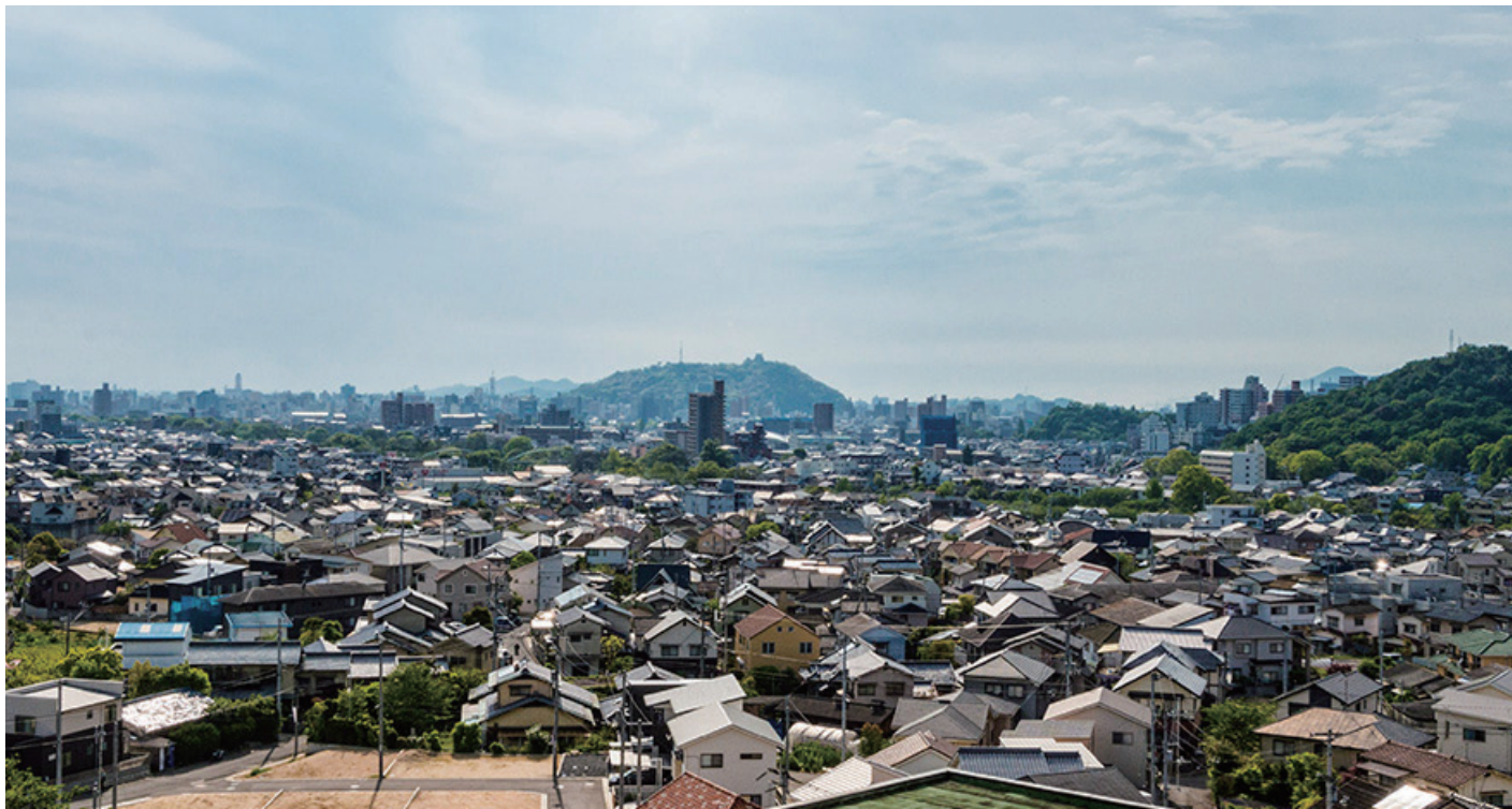
松山城や海まで見渡せる展望台からの風景は、創業当時から変わらない。