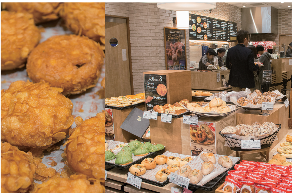
人気ベスト3は (1位) カリカリカレーパン (2位) クロワッサン (3位) 箱根クリームパン。 店内は赤ちゃん連れのお客さまから年配のお客さままで、幅広い世代で賑わっている。