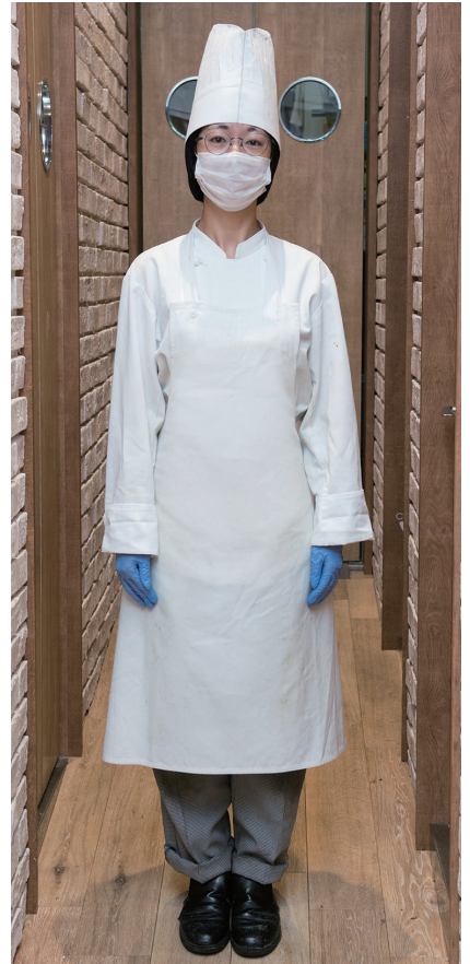
厨房スタッフの帽子、コックコート、エプロン、スラックスをユニフォームレンタルにしている。清潔感だけでなく、動きやすさも求めた結果、今のスタイルに。

「箱根ベーカリー」では販売スタッフのユニフォームは購入し、厨房のユニフォームをレンタルシステムにしている。「食べ物を作っているので、当然ユニフォームは衛生的でなければなりません。オーブンの煤 すす 汚れや、バターなど油分の汚れなどは、自分で洗おうと思っても、なかなか落ちないものです。でも、レンタルシステムでは回収されたユニフォームがしっかりとキレイにクリーニングされて戻ってくるので、お客さまに安心していただけるだけでなく、食を提供する側のこちらも安心してきます。それに、厨房スタッフも試食やパンの陳列、ピザ釜の前でトッピングするなど、お客さまの前に出ることがあるので、衛